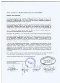
Comentarios y observaciones al PROT 001.jpg 496K